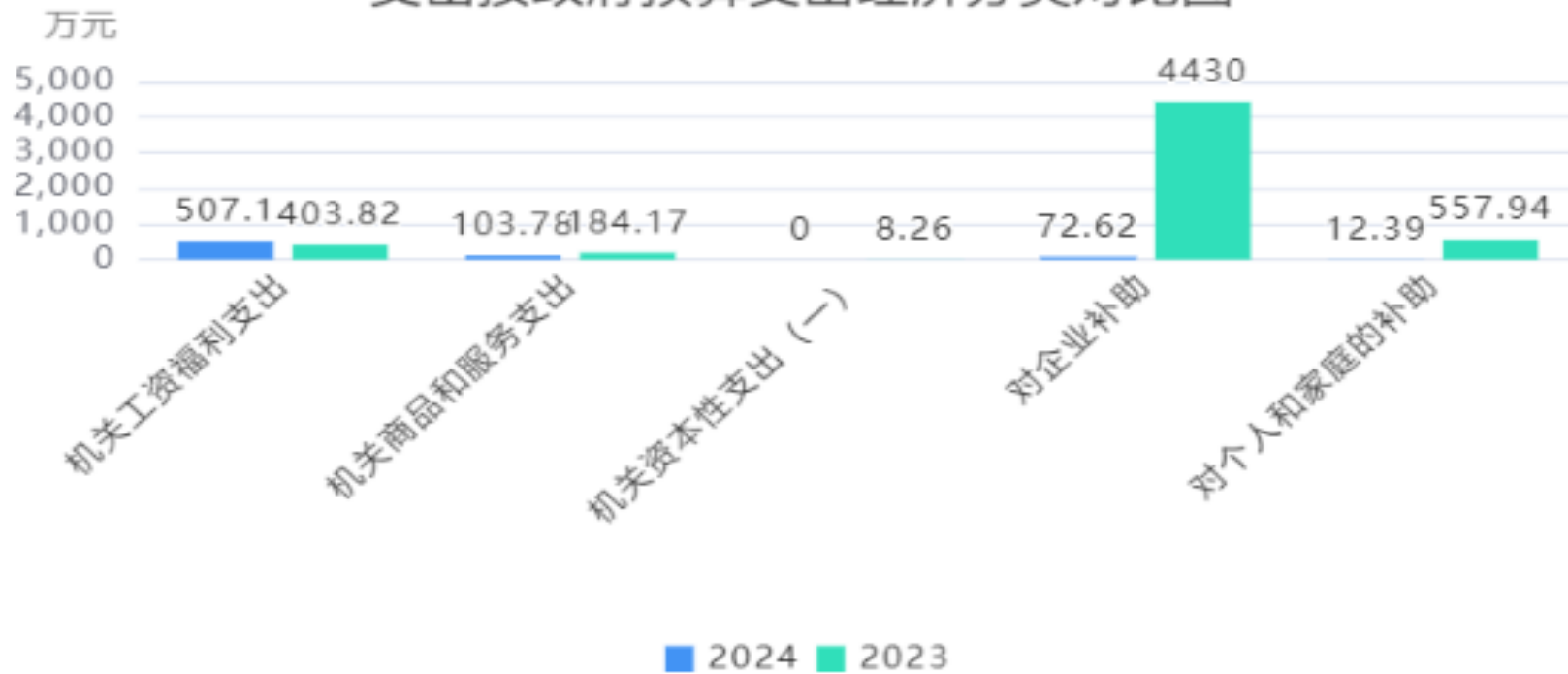
支出按政府预算支出经济分类对比图